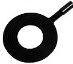
300MM WAFER HANDLING TIP